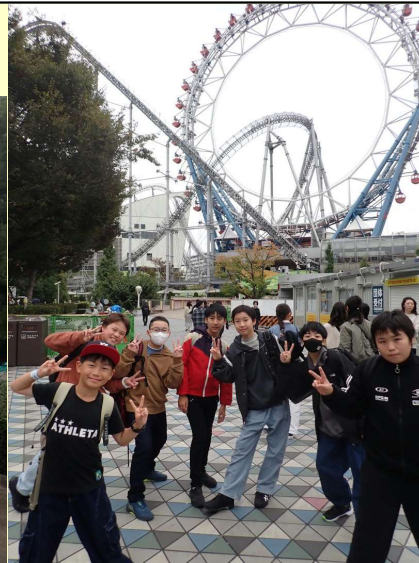
【最後はお楽しみの東京ドームシティ】 楽しい二日間はあっという間に過ぎました。子どもたちはもう一泊したかったそうです。