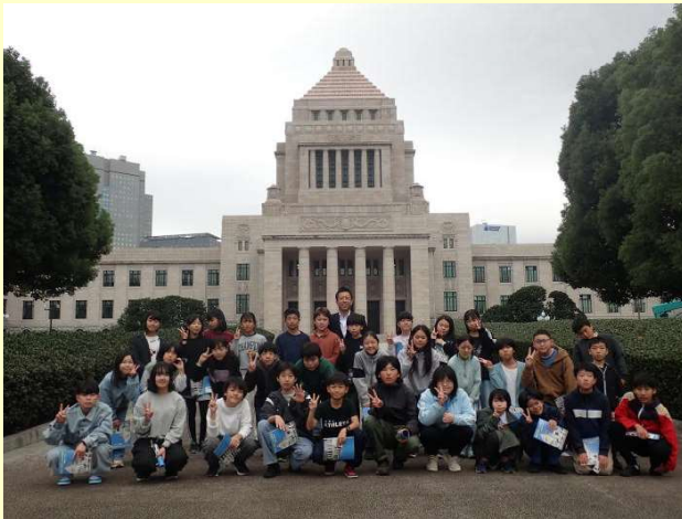
【国会議事堂】議員さんと一緒に「はいポーズ！」政治の中心を体感