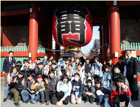
【浅草】 雷門前で「ハイポーズ！」 外国人観光客の多さにびっくり！